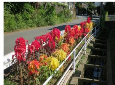
ホームページにカラー写真があります(広報部)