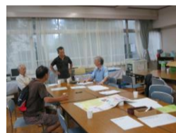
中止の善後策を検討する三役と高齢者部長