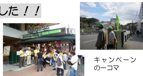
キャンペーンの一コマ

秋の全国交通安全運動の一環として開催される恒例の『秋の駐輪・駐車正常化キャンペーン』が9月25日(水)・26日(木)の二日間にわたり行われました。初日はあいにくの雨でしたが、二日目は天候に恵まれ、地域の町内会、自治会、学校、商店会、熟年クラブなどから、二日間を通じて延べ368名の方々が、駅の北側と南側でなごやかな交流を楽しみながら参加されました。