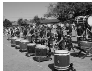
勇壮な和太鼓の演奏 上手にけん玉遊び

なお、この「秋の子どもまつり」には、ボーイスカウト町田第13団、国土館大学キッズライク同好会、早稲田大学マジックサークル、皆さんの協力を頂きました。