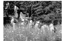
コスモスの 咲く中を

帰路は、一旦野津田車庫前に下って、そこのバス停よりバス帰宅者が20名位居りましたが、残りの参加者は元気に、解散地点の「ゆうきやま保育園」の付近に無事戻り、午後3時半頃そこで解散となりました。今回は、往復距離約12Km、歩数計で約2万歩超の行程でした。