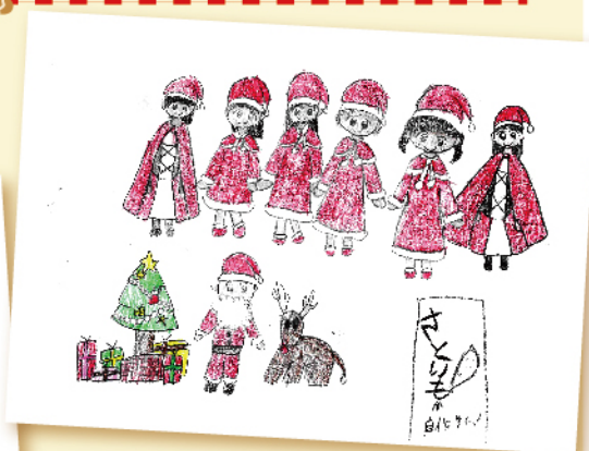
小学3年生 ペンネーム:さといも 小学3年生 ペンネーム:ミカンちゃん