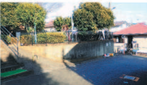
手前右が消火栓の位置

本紙12月号でも紹介されたように、スタンドパイプ操作訓練は、地区ごとに行われるようになり、実際に操作したという人は増えてきていると思います。スタンドパイプは火災を地域住民で消火するために大きな役割を果たすもので、防災倉庫内だけでなく、消火栓の近くに配置されることが望ましいものです。