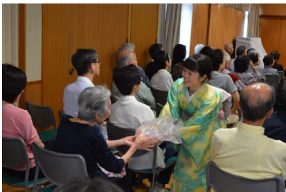
じゃんけんゲーム☆

うっとりしたり、写真 を撮ったりなどして いると、遮断機が上が ったのにも気づかず、 ついつい向こうへ寝 りそびれてしまうほ どです。