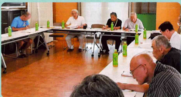
木曾町・木曾西1～5丁目・木曾東1～4丁目