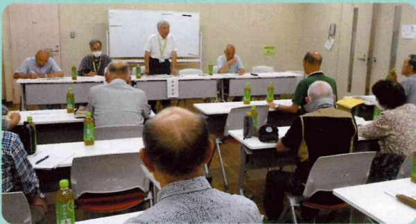
図師町・忠生・根岸 (合同)