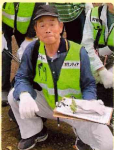
駅前清掃ボランティア