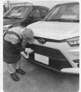
猛暑の中で、就業する90歳の会員さん。車を傷つけないように慎重に作業

安全管理委員会では、安全巡回(通称、安全パトロール)も毎月続けています。写真は中古車センターで就業中の会員さんで、炎天下でも頑張っています。11月に入ると涼しくなりますが、昨年のこの時期で、植木剪定や駐車場管理でけがをされた会員さんがいます。ちょっとした不注意から事故にならないように、普段からKYの心掛けをお願いいたします。