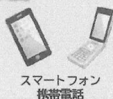
スマートフォン 携帯電話