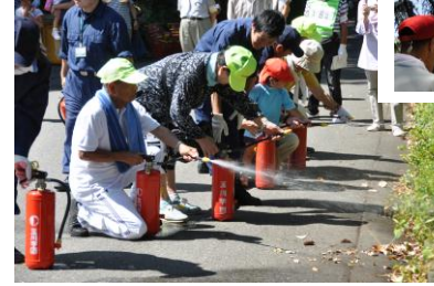
写真左・消火器による放水訓練 写真上・梯子車の試乗

当日の参加者は、残念ながら、昨年比で約 130 名の減少でしたが、これは、当日の猛暑を考慮して高齢者の参加自粛を呼びかけた地域もあったようで、やむを得ないものと思われます。当町内会では従来から防災訓練を 8 月後半の土・日に実施してまいりましたが、今後もこの日程を維持することは難しくなっているようで、実施時期の見直しが必要ではないかと思えます。そこで、この防災訓練日程の変更と内容の充実とを合わせて、今後も検討を重ねることといたします。