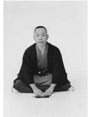
古今亭志ん輔師匠

1 月 25 日 (金) までに町内会事務所郵便受けに投函するか、725-0438 に FAX するか、町内会事務所まで郵送してください。