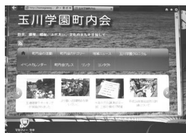
町内会ホームページ