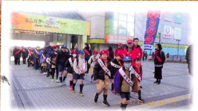
町田消防少年団による歳末防火巡回広報