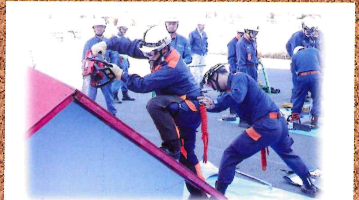
総合震災消防訓練