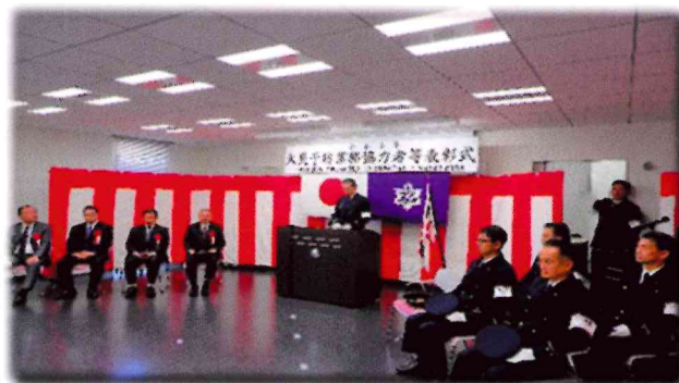
火災予防業務協力者表彰式