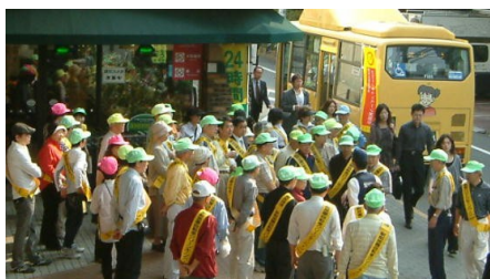
朝7時30分 第一陣集合